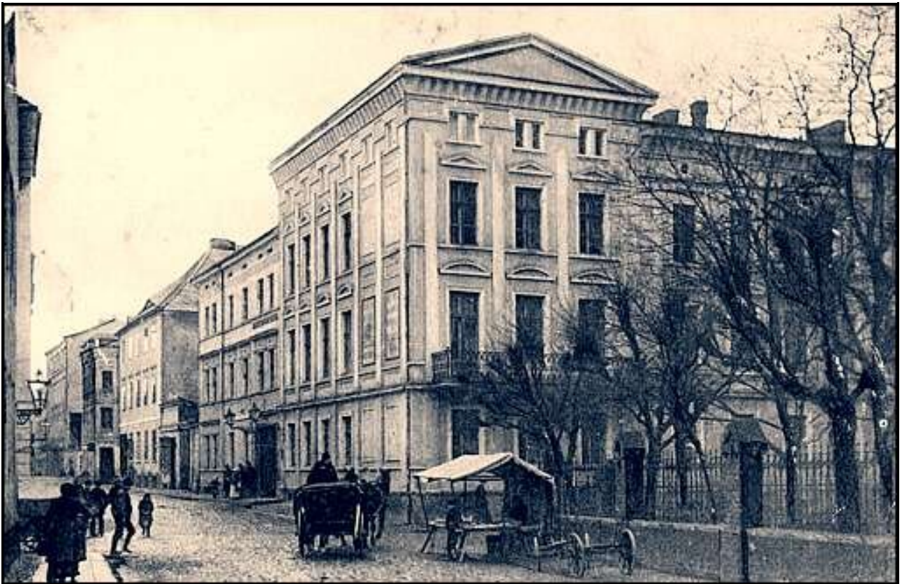
Budynek w 1912 roku (pocztówka ze zb. MOZK) i już po przebudowie (foto z 1942 roku, archiwum redakcji).